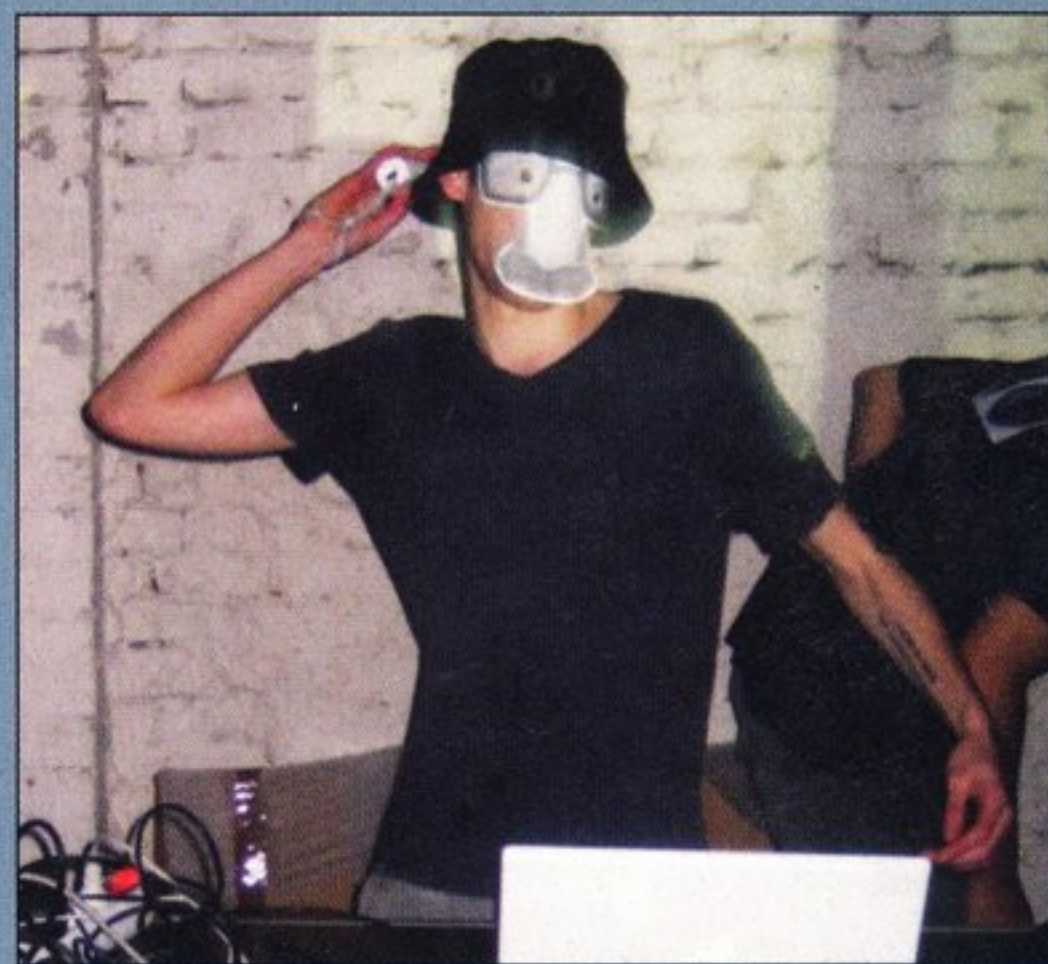
Auch absurde Verkleidungen sind gerne gesehene Gadgets im Laptop-Battle – hier in Kombination mit einer Wiimote